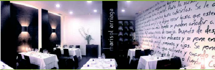
Restaurante Marisol Arriaga en Logroño (La Rioja)

Estas conferencias son una iniciativa de la Agencia de Desarrollo Económico de La Rioja (ADER), a través del CEdiR y con la colaboración de la Dirección General de Educación que vienen a dar continuidad a las realizadas a lo largo del año 2002.