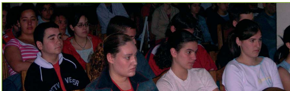
Asistentes a la charla en el IES Camino de Santiago