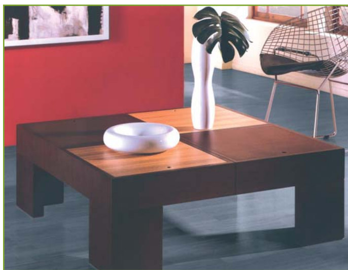
> Modelo Massaia

El proyecto cuenta con la colaboración de la Agencia de