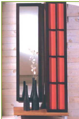
> Modelo Cintia

El pasado mes de junio realizaron la presentación oficial de sus prototipos con un