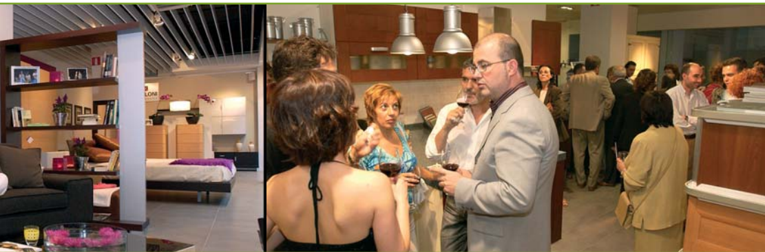
De izda. a dcha.: Catering en el exterior del local / Momento de la performance / Interior del nuevo local