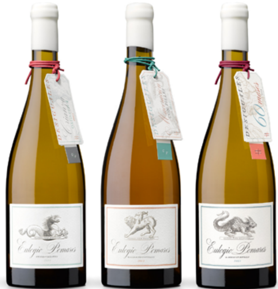
Colección Grandes Vinos Desiguales de Eulogio Pomares.