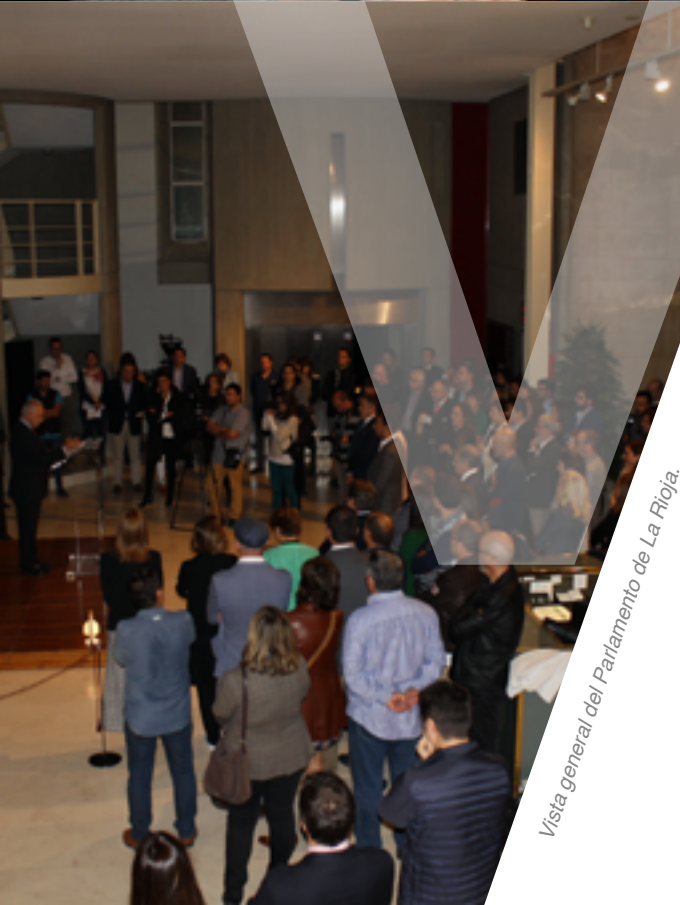
Vista general del Parlamento de La Rioja.

al desarrollo social y económico de La Rioja. Además, persiguen potenciar e impulsar el diseño en La Rioja al tiempo que invitan a la sociedad riojana a apreciar y comprender el valor del diseño . Desde su quinta edición, los Premios CEdiR sumaron a sus dos categorías tradicionales, de Empresa y Diseño , una nueva categoría, denominada Obra de Construcción , que reconoce la imagen de marca de la empresa.