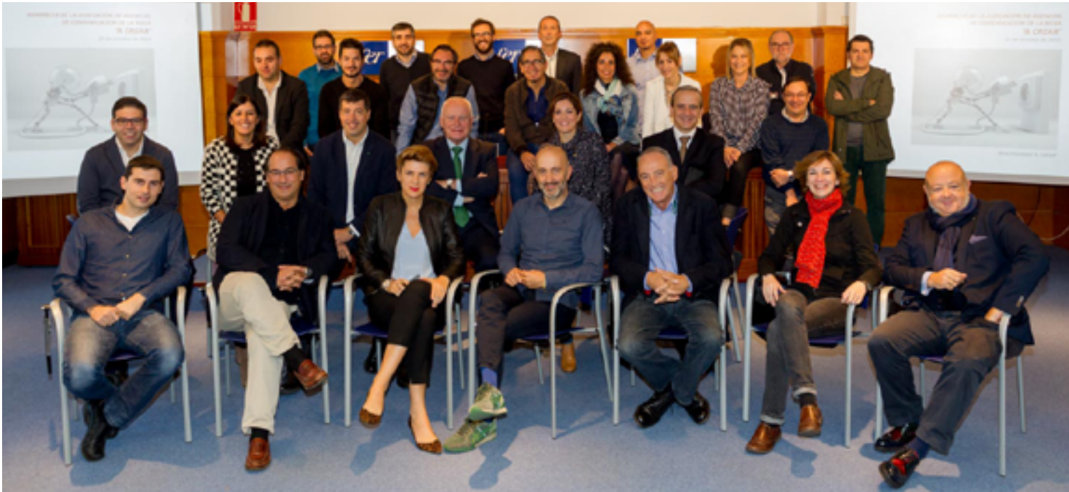
Foto de grupo de la nueva junta directiva.

Entre sus objetivos, A CREAR impulsará la profesionalización de las áreas de comunicación, publicidad y marketing de las empresas.