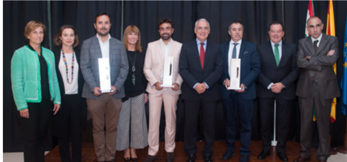
Foto de grupo de los Premiadados con los representantes institucionales.

La Gala de Entrega de los Premios CEdiR se celebró el pasado mes de octubre en un marco incomparable, el antiguo “Convento de la Merced”, en la actualidad sede del Parlamento de La Rioja . El Parlamento abrió sus puertas al mundo del diseño a las siete de la tarde y el acto protocolario se desarrolló bajo el marco de la puerta que da entrada al claustro que da cobijo al hemiciclo parlamentario.