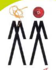
TRAS EL ESPEJO