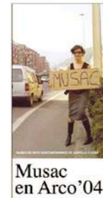
Musac en Arco'04