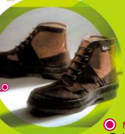
CALZADOS FAL BOTAS CHIRUCAS